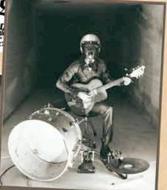
BOB LOG III