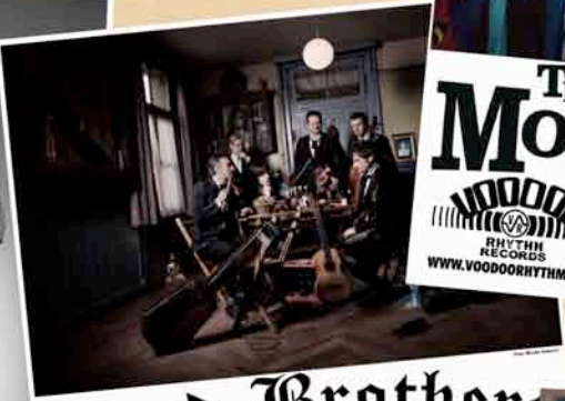
Dead Brothers 5th Sin-Phonic